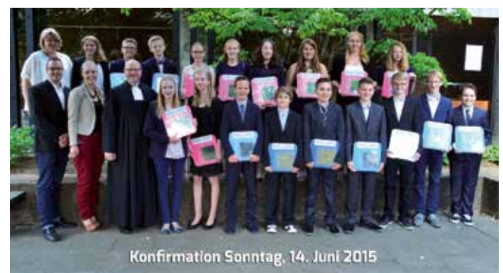
Konfirmation Sonntag, 14. Juni 2015