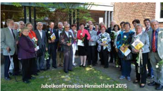
Jubelkonfirmation Himmelfahrt 2015