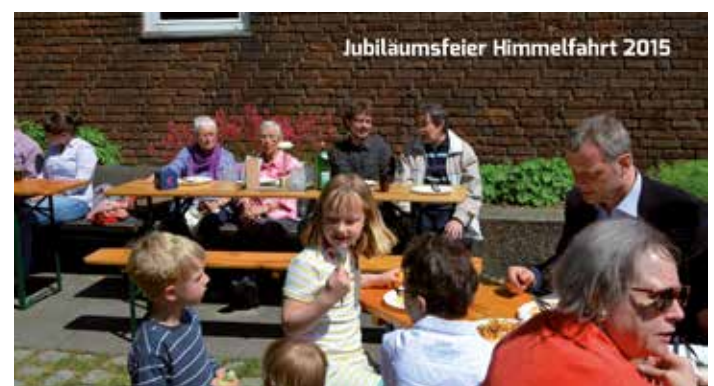
Jubiläumsfeier Himmelfahrt 2015