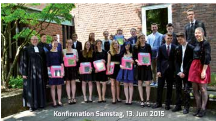
Konfirmation Samstag, 13. Juni 2015

Erntedankgaben können Sie bis zum 2. Oktober im Matthäus-Kindergarten oder in der Kirche abgeben. Herzlichen Dank für alle Gaben, mit denen Sie vielen helfen!